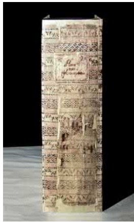
Uno dei due faldoni delle Plantæ non officinales